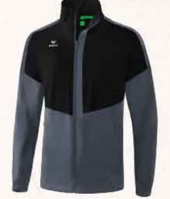
VESTE TOUS-TEMPS CHF 75,-