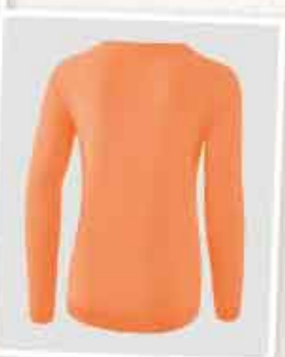
VUE DE DOS FEMMES