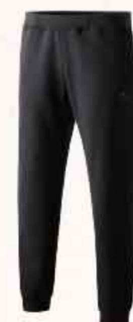
♂ 210330 noir