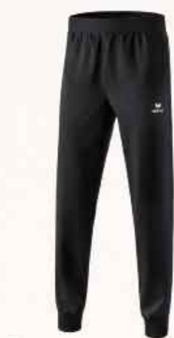
1101801 1101802 noir