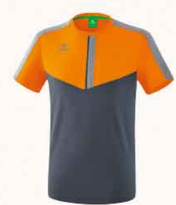
T-SHIRT CHF 55,-