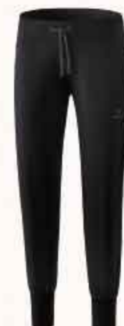
♀ 2101801 noir