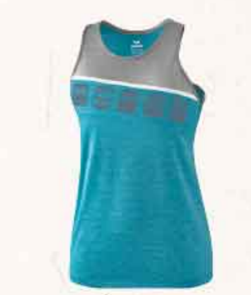
DÉBARDEUR CHF 50,-