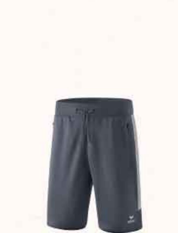
SHORT WORKER CHF 40,-