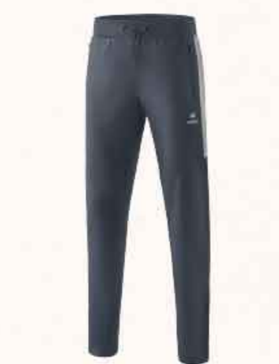
PANTALON WORKER CHF 55,-