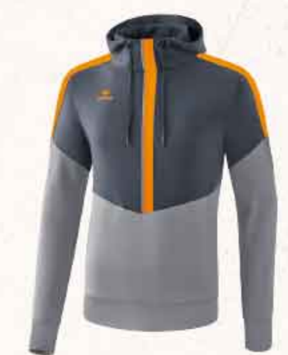
SWEAT À CAPUCHE CHF 85,-