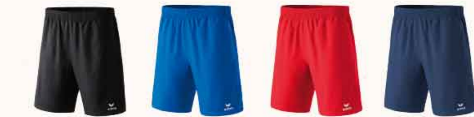
109330 109333 noir 109331 109334 new royal 109332 109335 rouge 109336 109337 new navy

Enfants: T. 0-3 CHF 30,-* Hommes: T. 4-12 CHF 40,-* Femmes: T. 34-48 CHF 40,-*