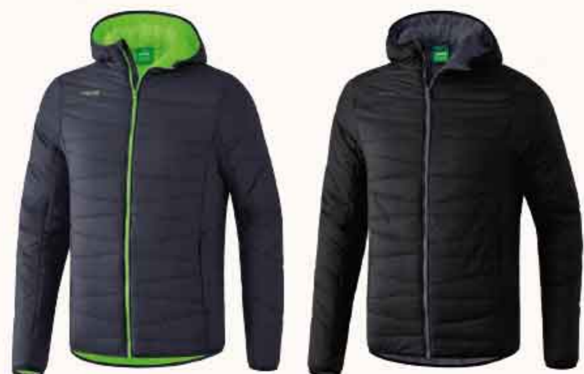
♂♀ 9060702 ♀ 9060706 gris foncé/green gecko