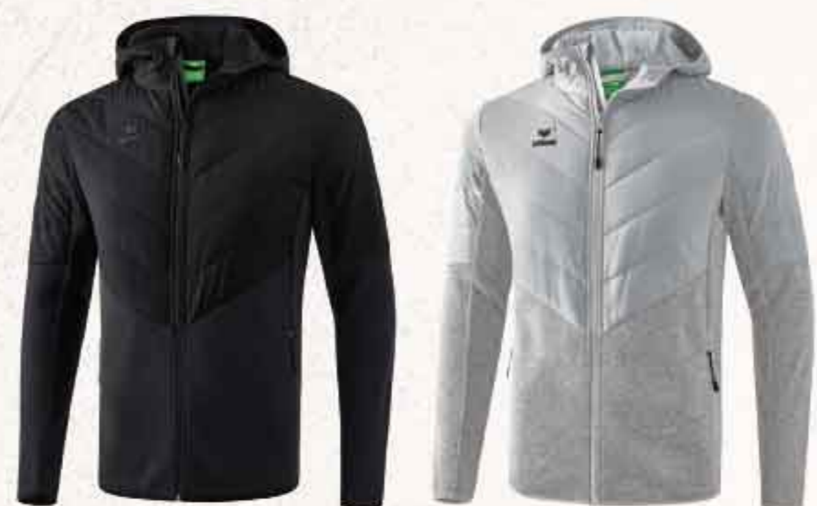
♂♀ 2061905 ♀ 2061909 noir