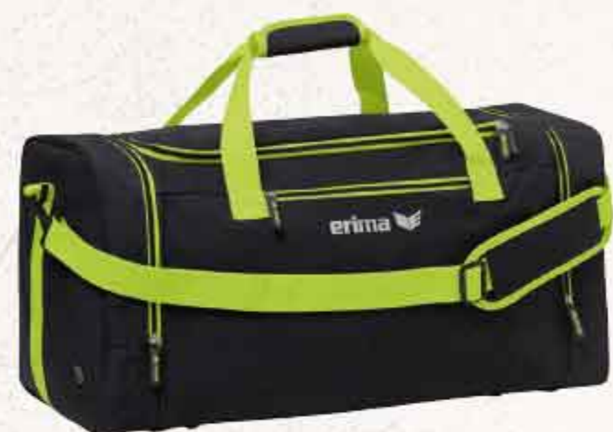
7232116 noir melange/lime