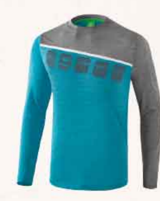
LONGSLEEVE CHF 60,-