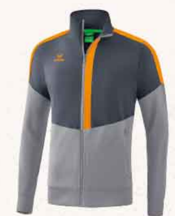
VESTE WORKER CHF 70,-