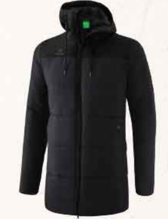
VESTE D'HIVER CHF 170,-