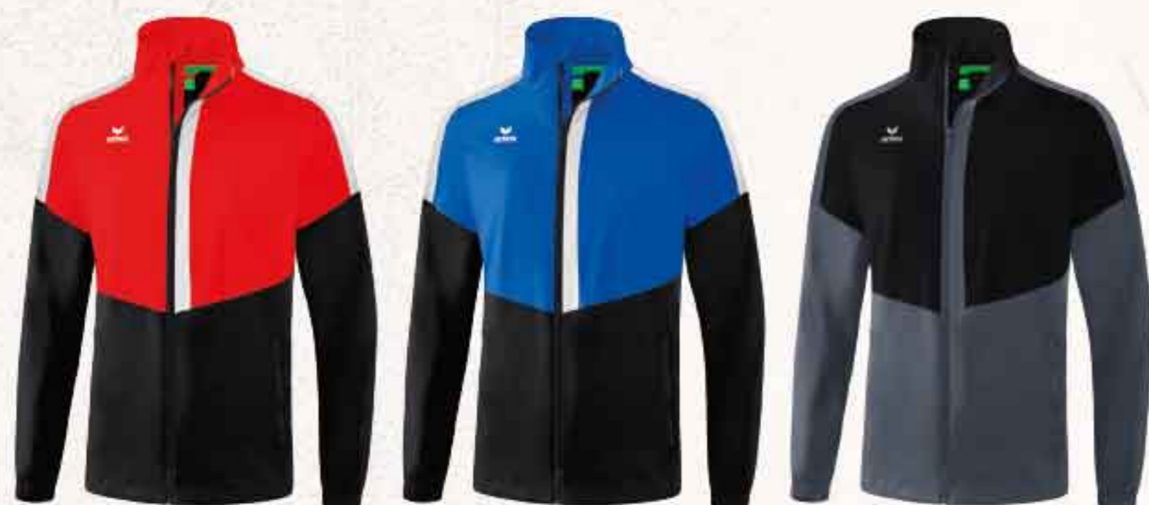
1052001 rouge/ noir/blanc