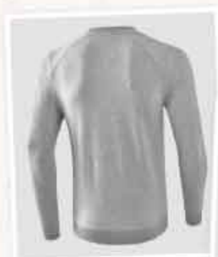
VUE DE DOS HOMMES