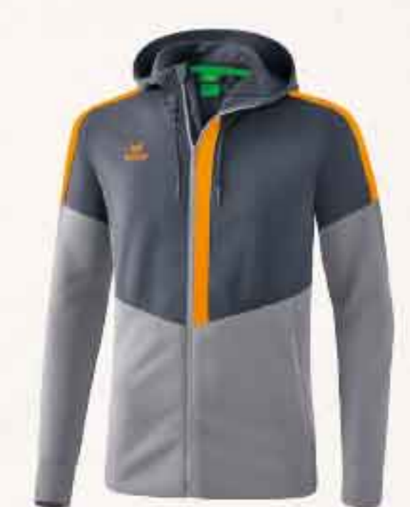
VESTE D'ENTRAÎNEMENT À CAPUCHE CHF 90,-