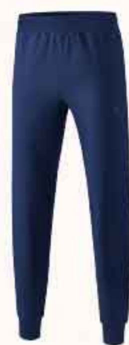
1102015 1102016 new navy