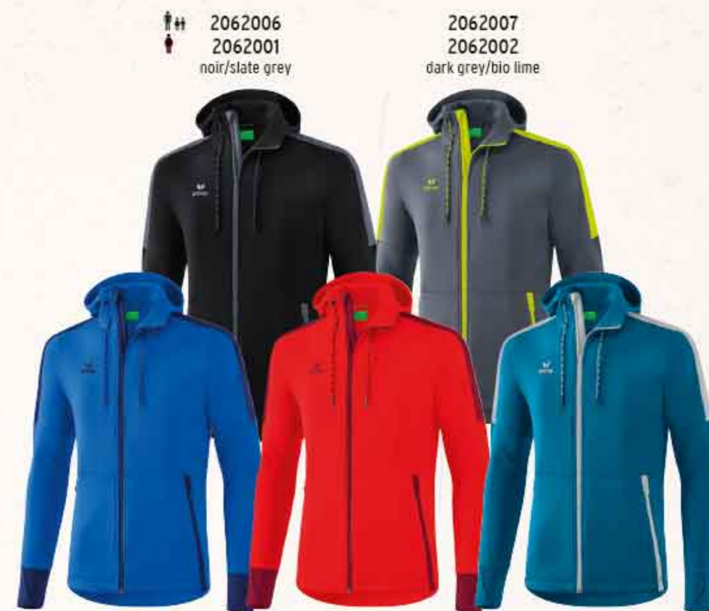
♂♀ 2062006 ♀ 2062001 noir/slate grey