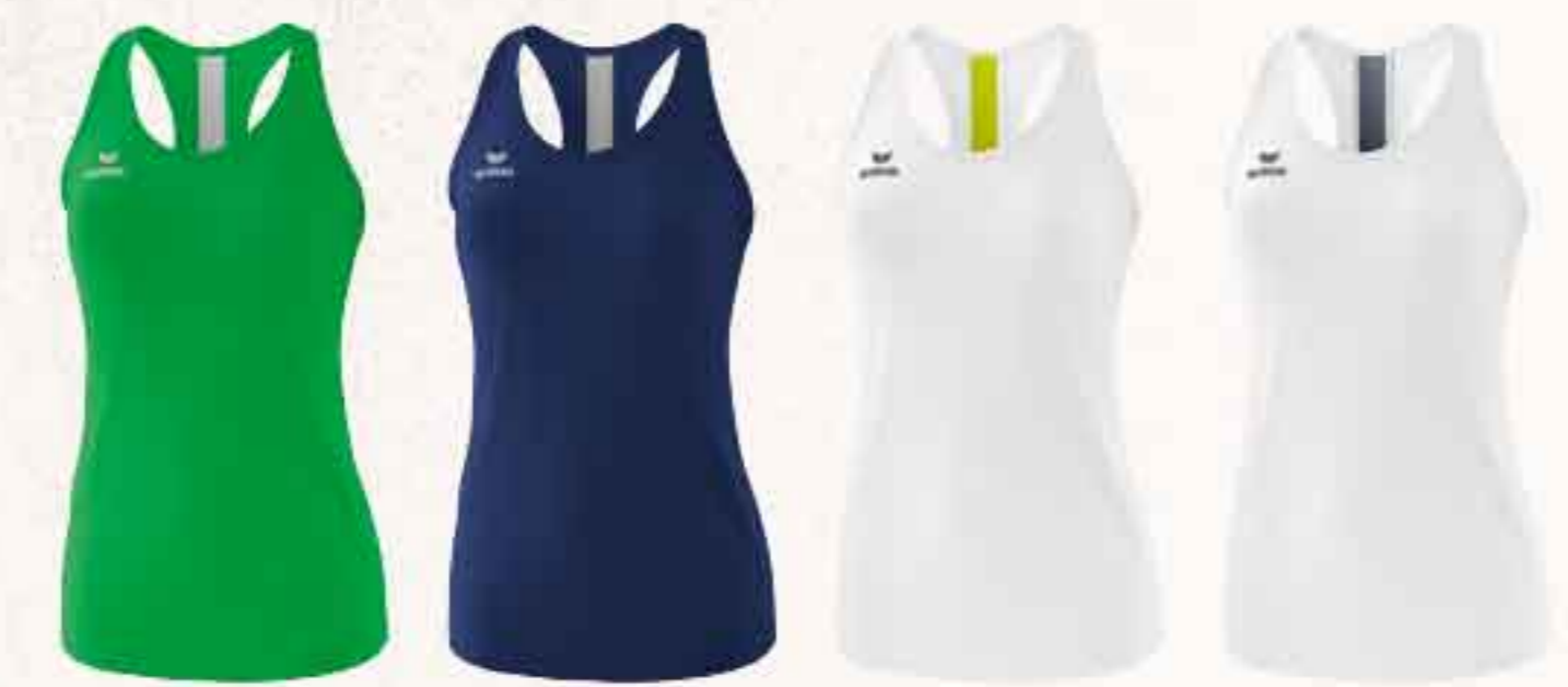
1082008 fern green/ émeraude/silver grey 1082009 new navy/ bordeaux/silver grey 1082010 blanc/ slate grey/bio lime 1082011 blanc/ new navy/slate grey