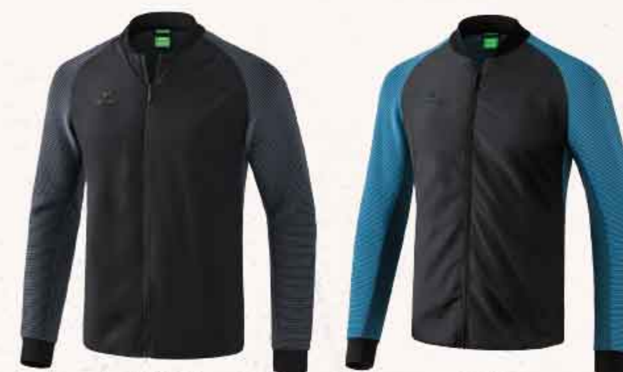
♂♀ 1011920 ♀ 1011921 noir/gris