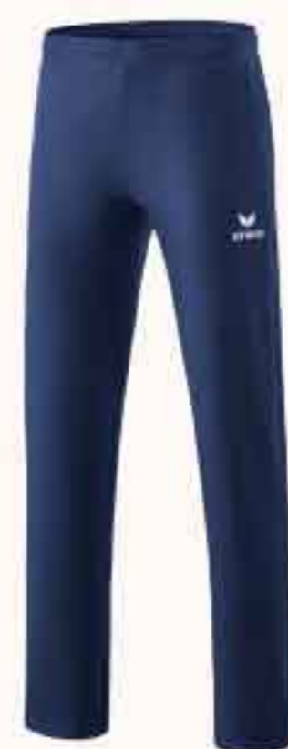
2101908 new navy/blanc