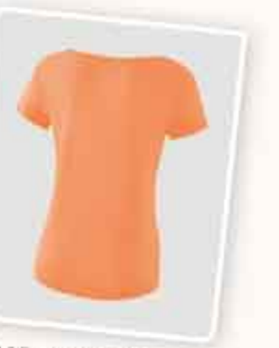
VUE DE DOS FEMMES