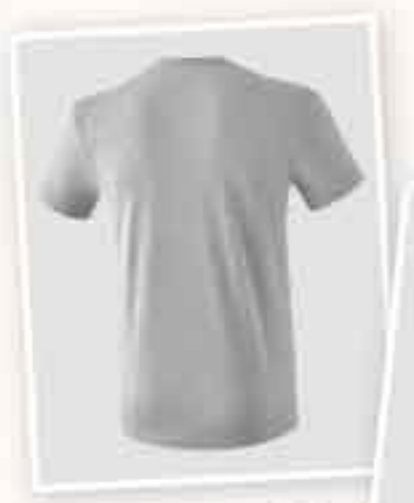
VUE DE DOS HOMMES