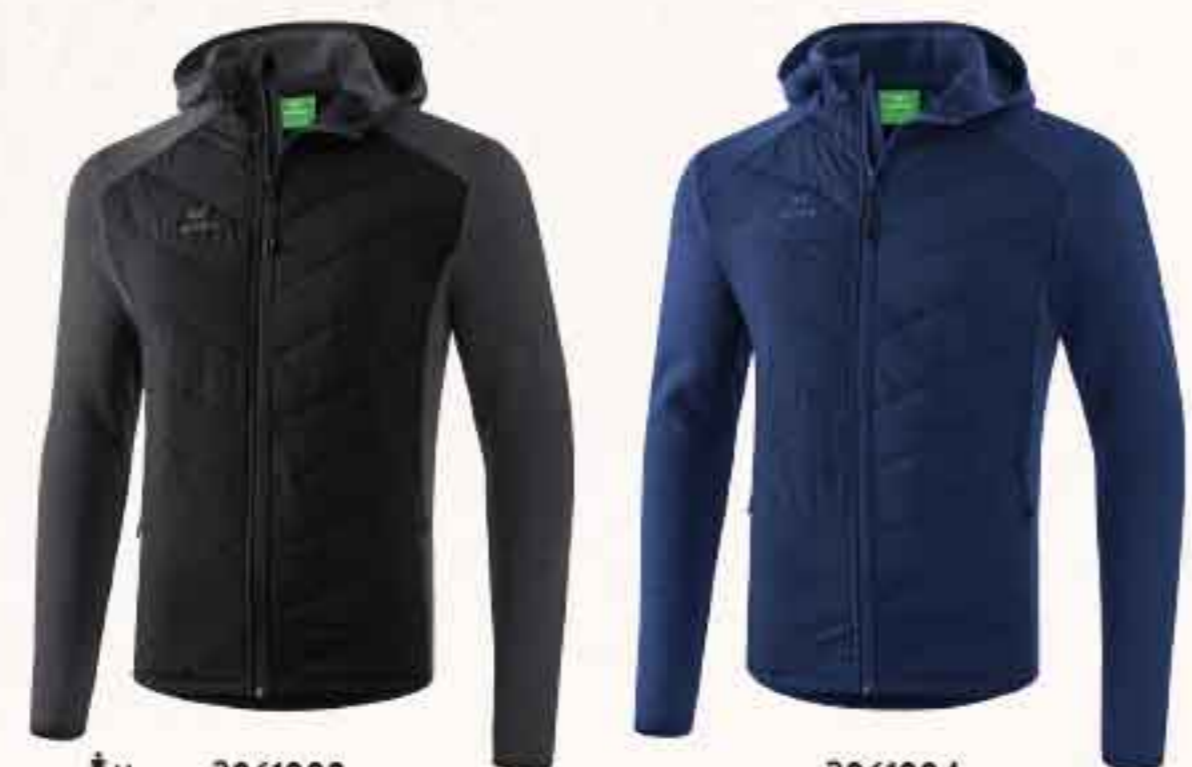
♂♀ 2061903 ♀ 2061907 noir