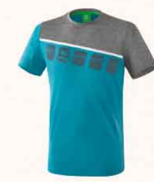
T-SHIRT CHF 50,-