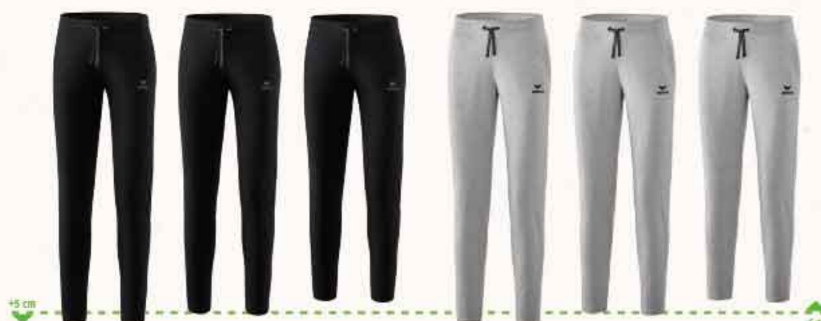
♀ 2101905 2101901 2101903 2101906 2101902 2101904 noir long noir normal noir court gris melange long gris melange normal gris melange court