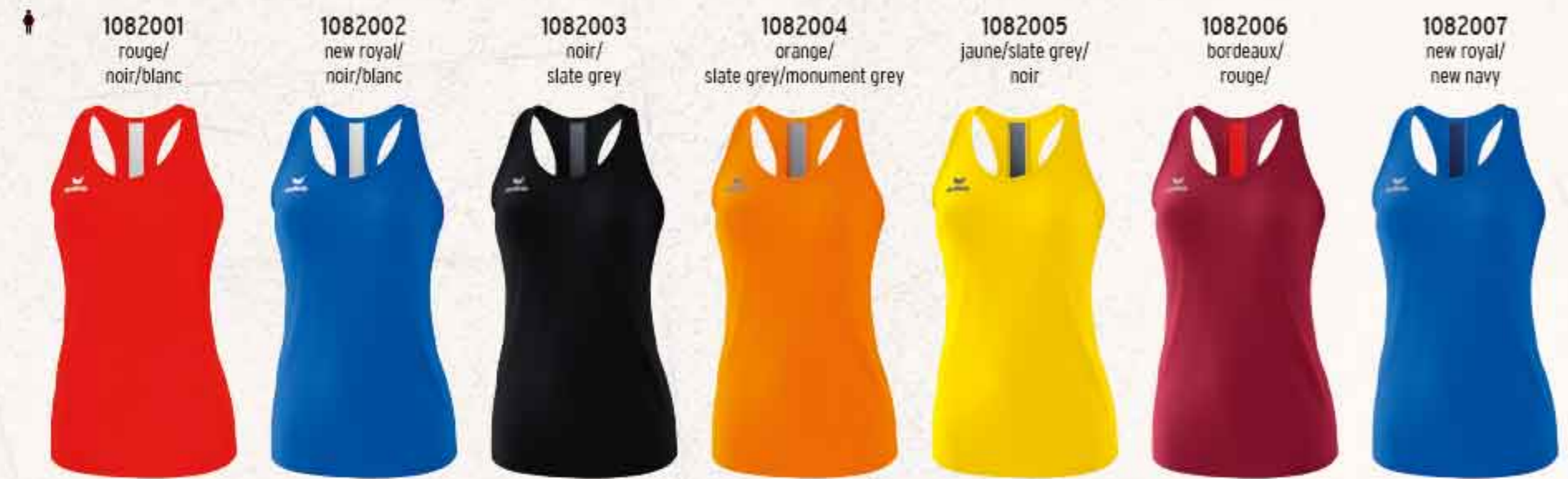
1082001 rouge/ noir/blanc 1082002 new royal/ noir/blanc 1082003 noir/ slate grey 1082004 orange/ slate grey/monument grey 1082005 jaune/slate grey/ noir 1082006 bordeaux/ rouge/ 1082007 new royal/ new navy