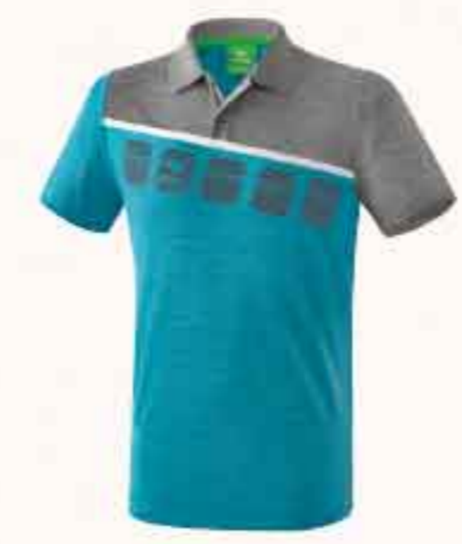
POLO CHF 55,-