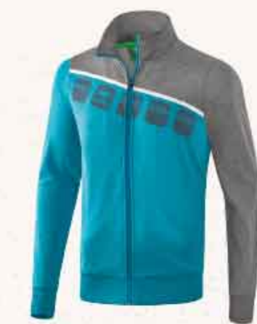
VESTE EN POLYESTER CHF 60,-