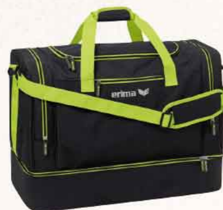
7232120 noir melange/lime