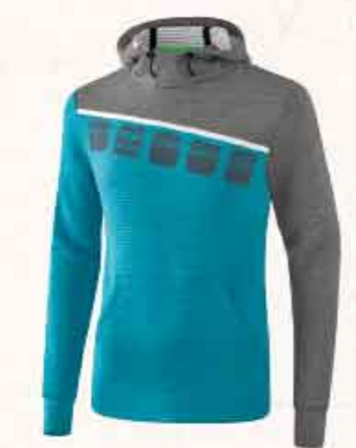
SWEAT À CAPUCHE CHF 80,-