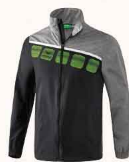
VESTE TOUS TEMPS CHF 70,-