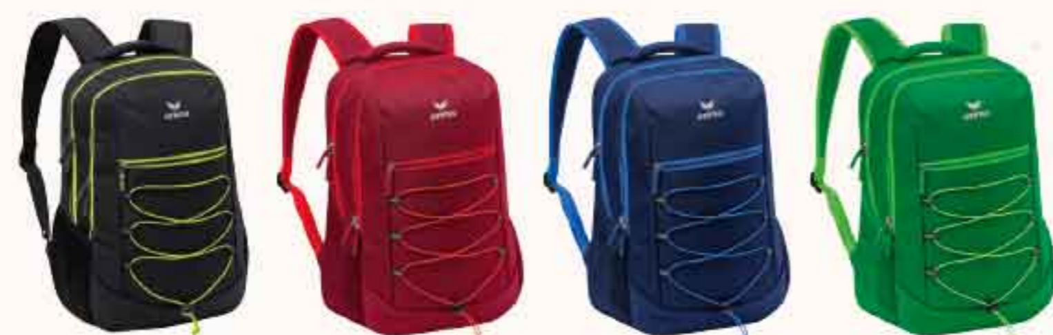
7232124 noir melange/lime