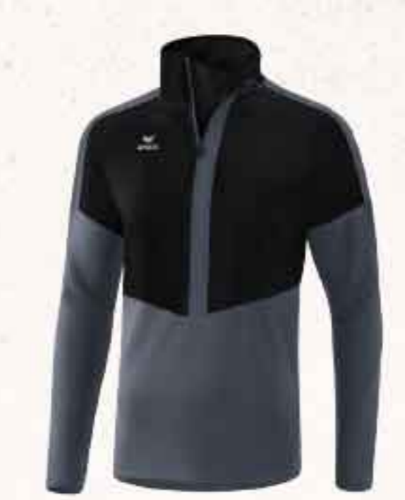
HAUT WORKER CHF 75,-