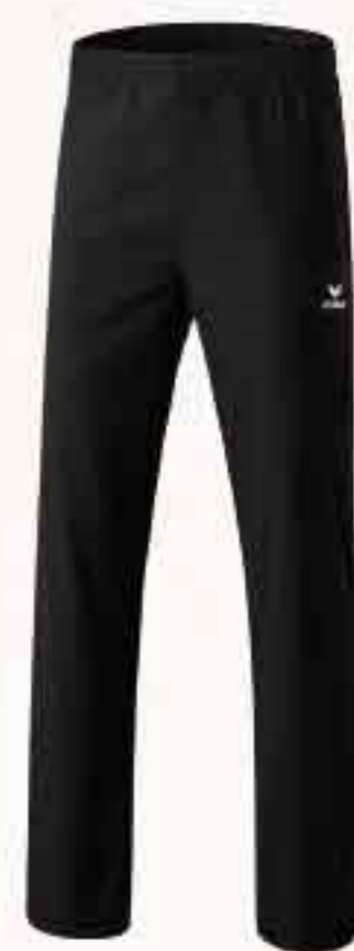
2100704 2100703 noir