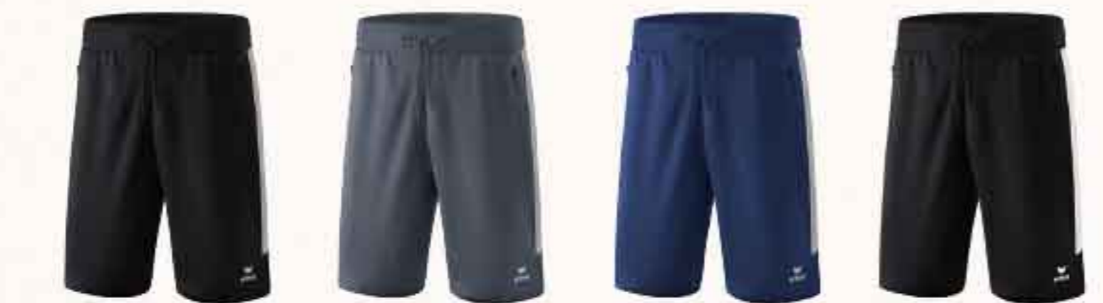
1152001 1152005 noir/silver grey 1152002 1152006 slate grey/silver grey 1152003 1152007 new navy/silver grey 1152004 1152008 noir/blanc

Enfants: T. 116-164 CHF 35,-* Hommes: T. S-XXXL CHF 40,-* Femmes: T. 34-44 CHF 40,-*