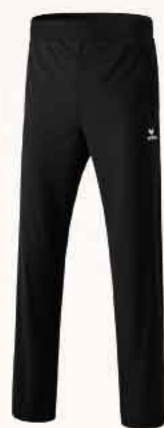
8100702 8100701 noir