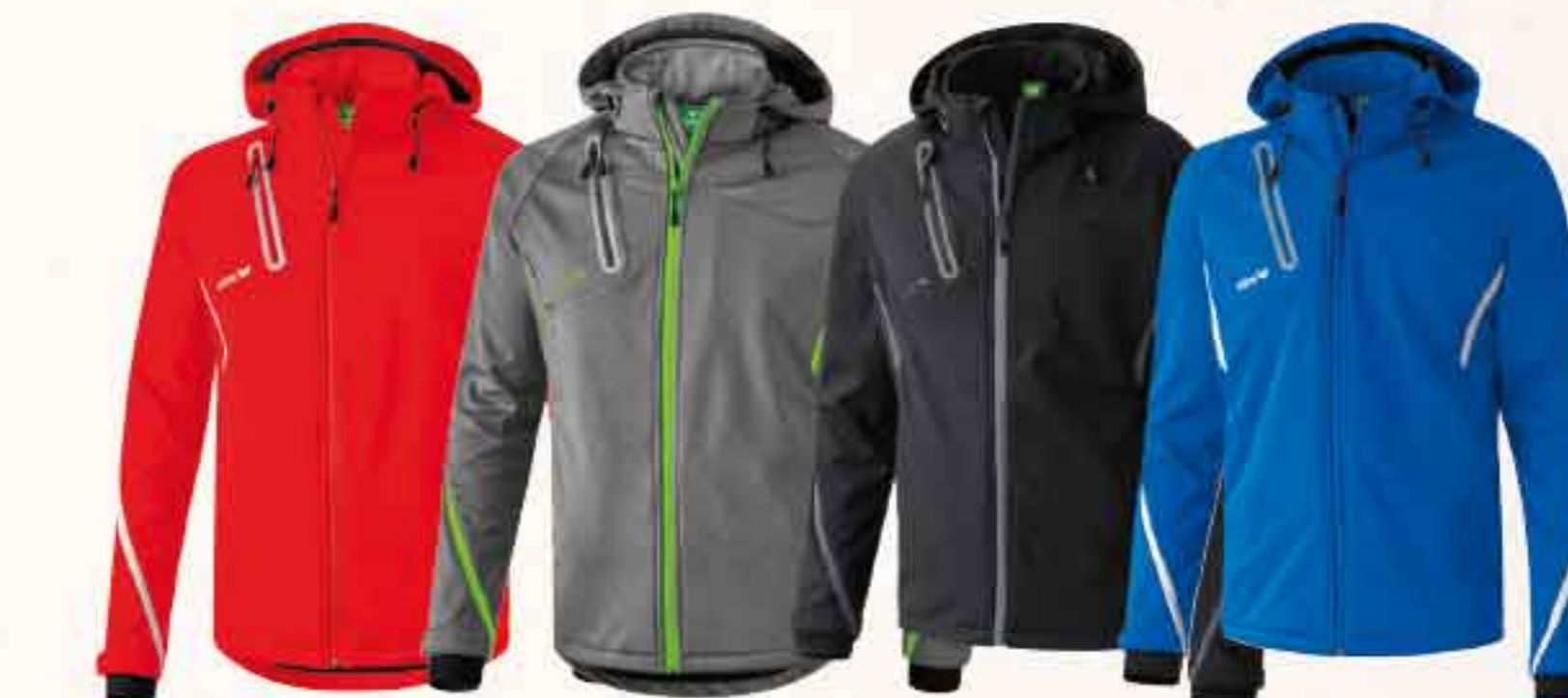
♂♀ 9060709 ♀ 9060711 rouge/blanc