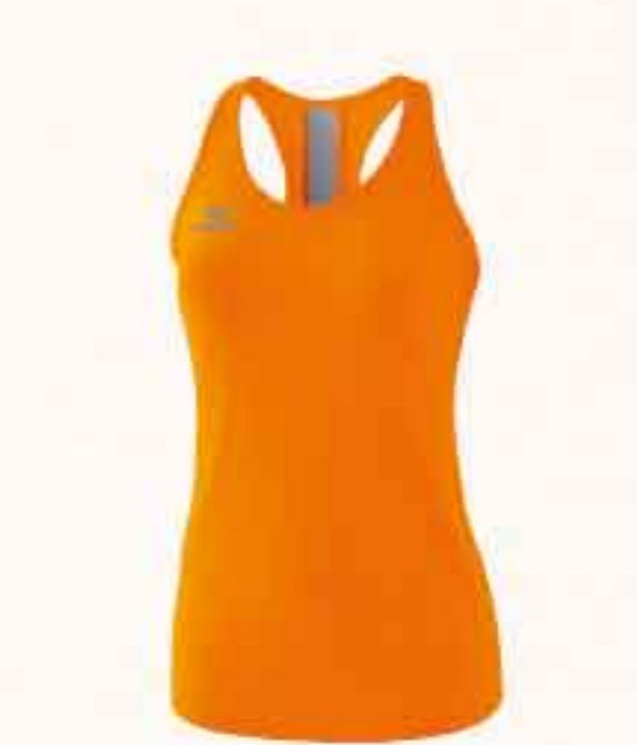
DÉBARDEUR CHF 55,-