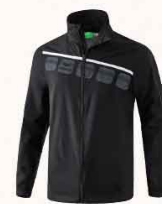
VESTE À MANCHES AMOVIBLES CHF 110,-