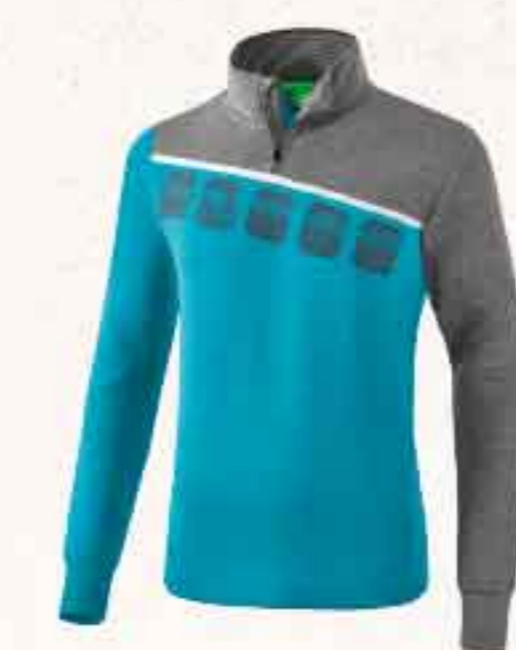
SWEAT D'ENTRAÎNEMENT CHF 70,-