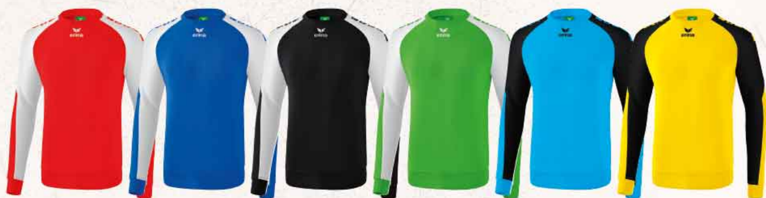
6071901 rouge/blanc 6071902 new royal/blanc 6071903 noir/blanc 6071904 green/blanc 6071905 curacao/noir 6071906 jaune/noir