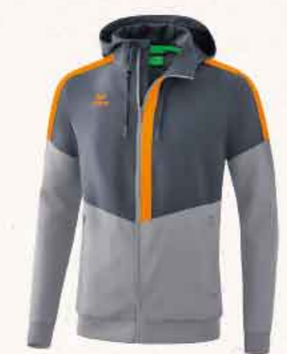
VESTE À CAPUCHE TRACKTOP CHF 95,-

Mix & Match : notre Teamline imprégnée de caractère séduit par ses lignes claires, elle peut être utilisée de façon polyvalente. Tout à fait classique pour le sport d'équipe ou moderne au quotidien avec un jean. Le mélange de matières de qualité supérieure est très apprécié pour ses propriétés confortables et fonctionnelles. Nos 11 combinaisons de couleurs garantissent une allure sobre, deux ou trois couleurs.