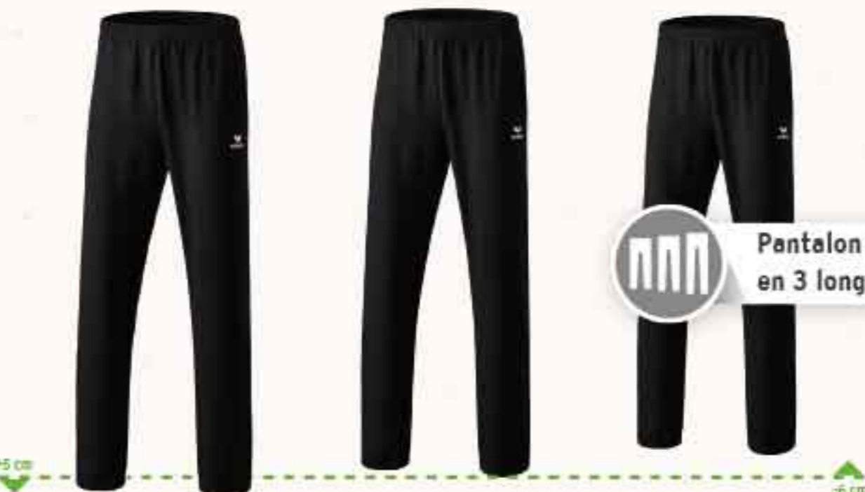
1100713 1100715 noir long 1100703 1100704 noir normal 1100712 1100714 noir court

Pantalon disponible en 3 longueurs différentes