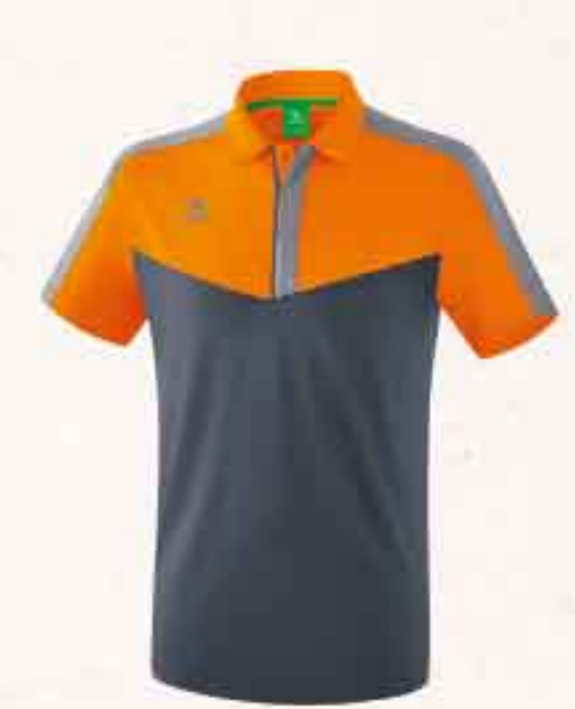
POLO CHF 60,-