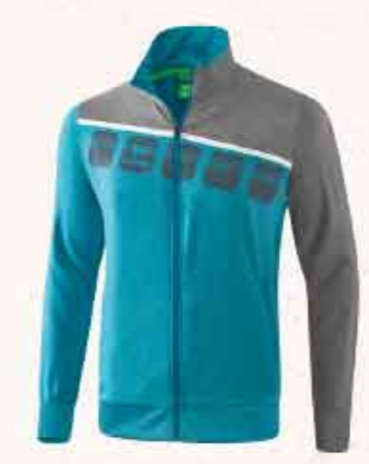
VESTE DE PRÉSENTATION CHF 85,-

Le design asymétrique rencontre l'impression stylée. Teamline 5-C offre un confort exceptionnel. La fonction intégrale et les détails sélectionnés constituent la collection. Elle est disponible en deux couleurs avec cinq cubes au design épuré. Assorti à la gamme Essentials et à notre gamme Essential 5-C Basics.