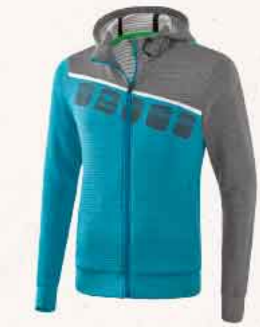
VESTE D'ENTRAÎNEMENT CHF 85,-