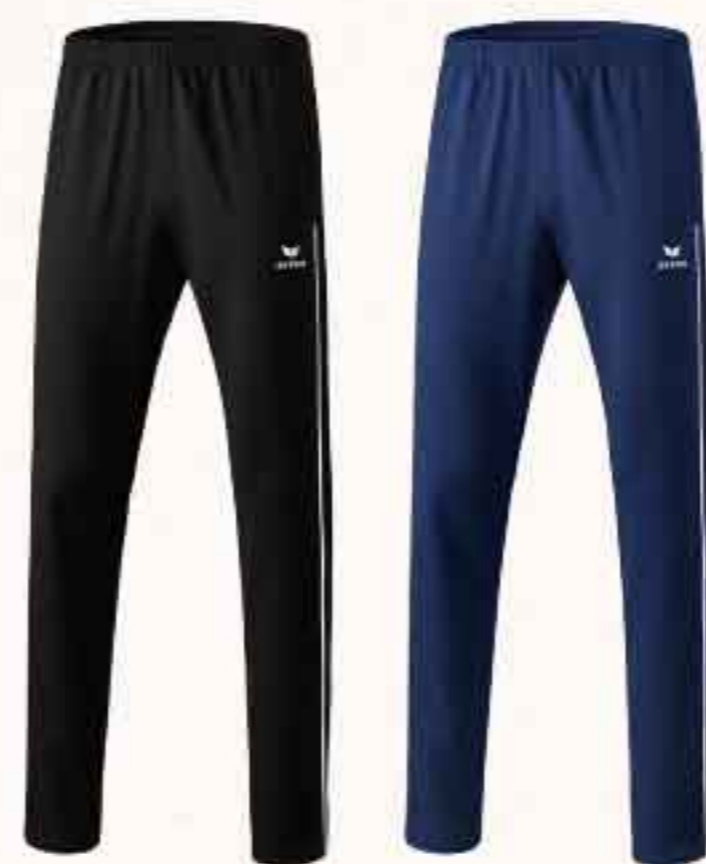
1100702 1100701 noir/blanc